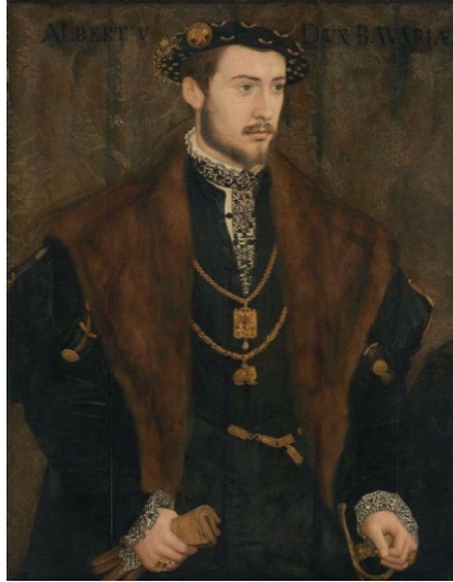
الصورة رقم (٢)

والمكتبة الثانية من هذه المكتبات هي مكتبة ولاية بافاريا في (ميونخ)، تأسست في بداية الأمر بوصفها مكتبة محكمة ميونخ Münchener Hofbibliothek، على يد الدوق ألبريشت الخامس Albrecht V Herzog [الصورة رقم (٢)]، عام ١٥٥٨م، وهي تمتلك حاليًا (٤٢٠٠) مخطوط إسلامي [الجدول رقم (٢)] (١٦) . إنَّها ثاني أكبر مكتبة في ألمانيا في مجال اهتمامنا، لا أقصد من حيث الأعداد التي تضمُّها فحسب.